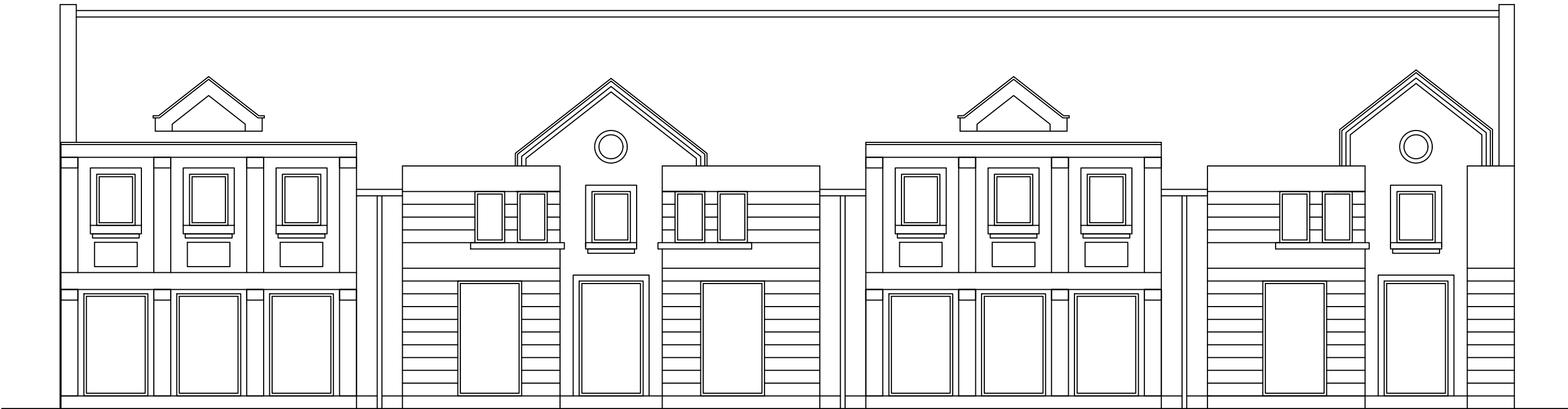
ELEWACJA POŁUDNIOWA (OD STRONY RYNKU)